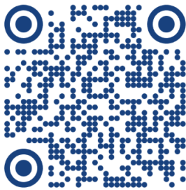
INCONTRO TECNICO 7 febbraio 2026