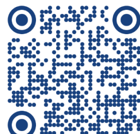
INCONTRO TECNICO 14 marzo 2026

Le riunioni saranno trasmesse anche in diretta sul canale YouTube "FCI CRDCS Toscana"